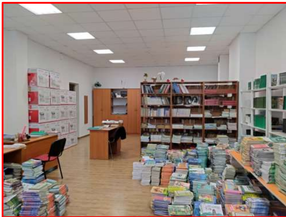
Нерациональное использование помещения