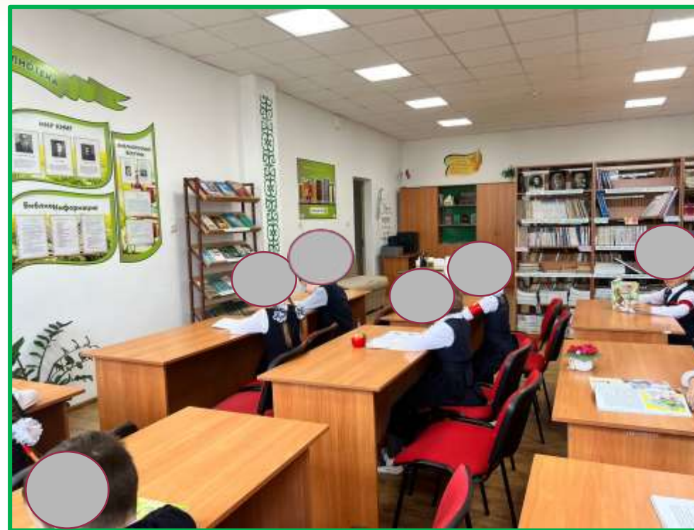
Созданы посадочные места